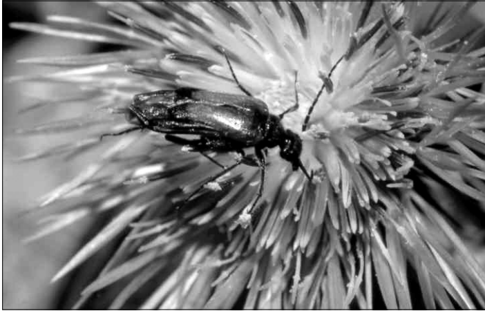
Stenoria canariensis (Pic, 1902). (Foto: R. García).

Stenoria canariensis : Oromí et al. en: Izquierdo et al. , 2004: p. 233