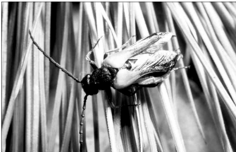
Sitaris solieri solieri Pecchioli, 1839. (Foto: R. García).

Sitaris solieri solieri : Oromí et al. en: Izquierdo et al. , 2004: p. 233